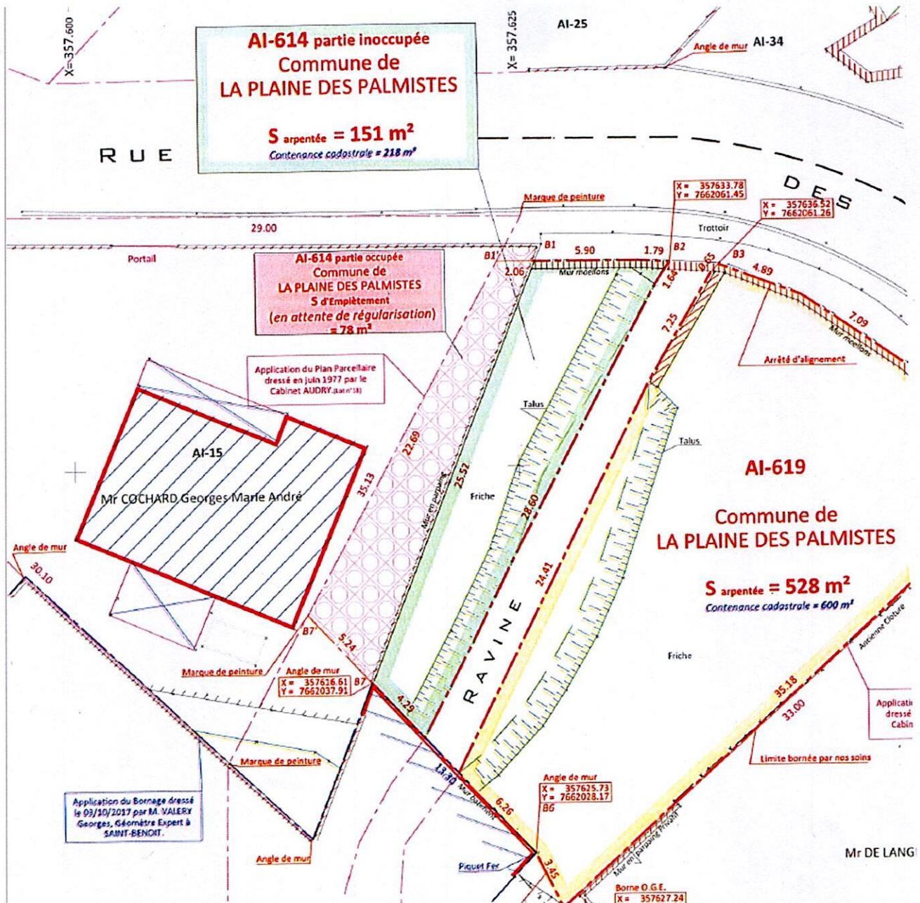
Plan de bornage AI 614 et 619